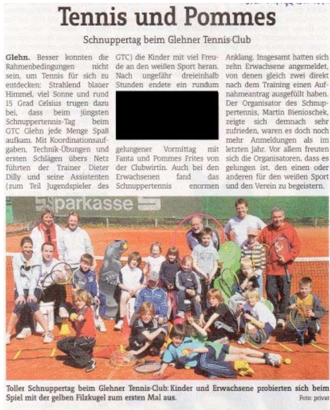
Zum ersten Mal auf dem Platz und schon in der Presse.