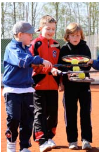
So sehen BioMacs beim Schnuppertennis aus.