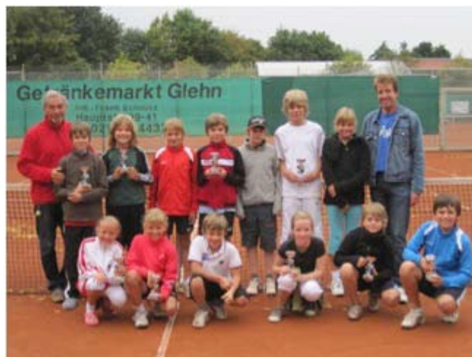
Die Teilnehmer der Jugend-Clubmeisterschaft 2010. Am Ende ging natürlich jeder mit einem kleinen Pokal nach Hause.