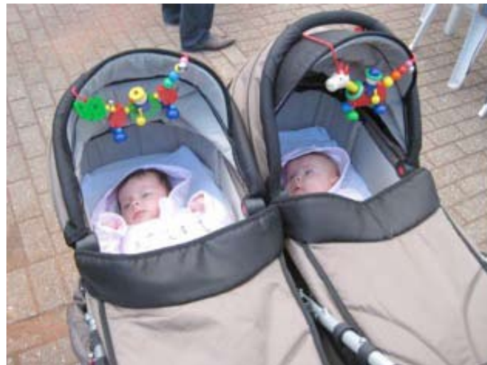
Martin, beantrage doch schon mal die Spielerpässe.