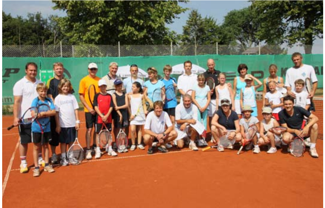
Besser konnte die Stimmung beim Eltern-Kind Turnier nicht sein. Das Wetter allerdings auch nicht: 34 Grad waren für den ein oder anderen schon eine kleine Herausforderung, sodass man den Spielmodus etwas verkürzen musste.

Wir sagen an dieser Stelle herzlichen Glückwunsch zu dieser tollen Leistung.