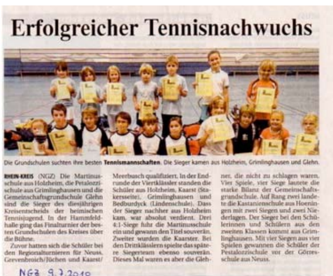
Bei den Drittklässlern konnten die Glehner Tennis-Kids den 1. Platz bei den Wettkämpfen der Schulen im Tenniskreis Neuss verteidigen.